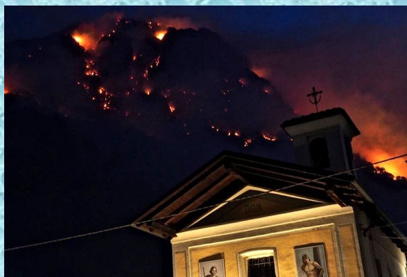
CAPRIE - INCENDIO OTTOBRE 2017